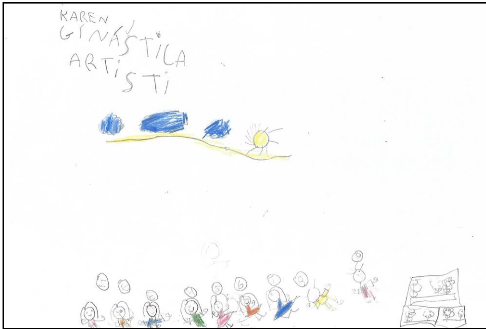
Figura 5 – Desenho retratando a aprendizagem