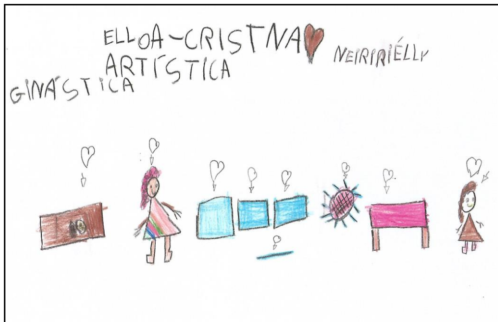
Figura 2 – Desenho retratando a aprendizagem.