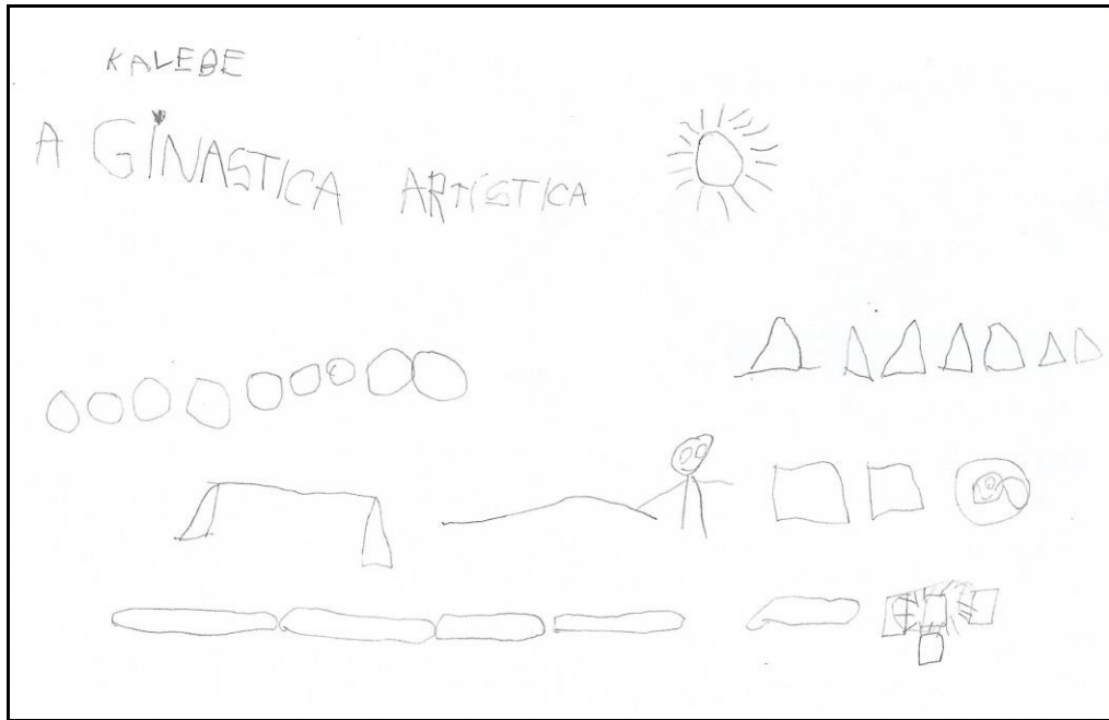
Figura 3 – Desenho retratando a aprendizagem.