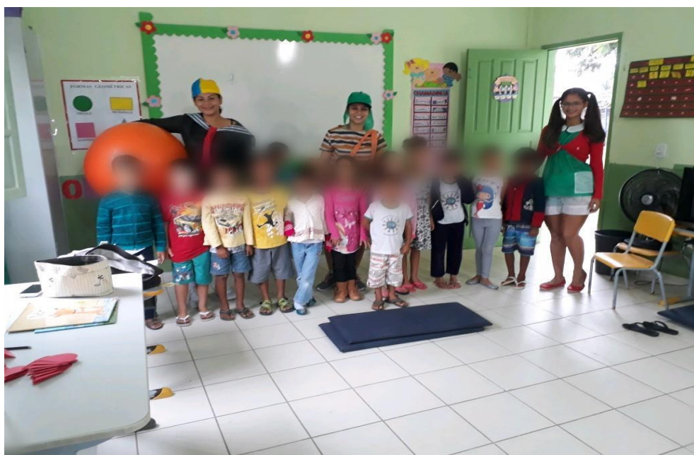
Foto 2 – Sala de aula com as crianças, os personagens do teatro e os materiais utilizados.