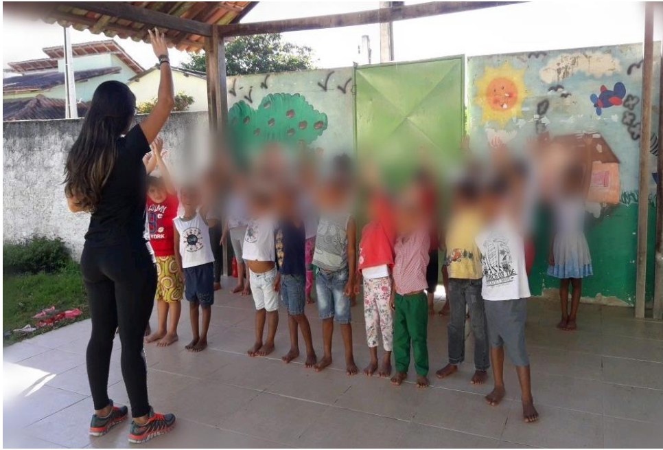
Foto 10 – Ensinando os movimentos para reconhecimento da lateralidade.