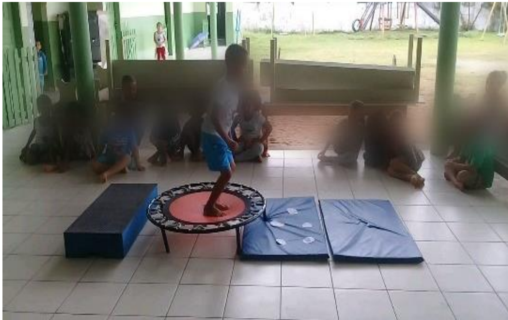
Foto 5 - Refeitório

cima do plinto, depois pular no jump que estava encostado no plinto. Logo na frente estava o colchonete simbolizando o mar sobre o qual eles teriam que pular sem cair para que os peixinhos e o povo não os pegassem. Mais à frente eles correriam e viraria a “cambalhota” (nome popular do rolamento frontal no solo, da ginástica) no colchonete e depois pulariam no outro plinto e encerrariam o circuito com a posição de avião. Iniciou-se a aula com a realização de alongamento dos membros superiores e inferior, em seguida, dando início à atividade.