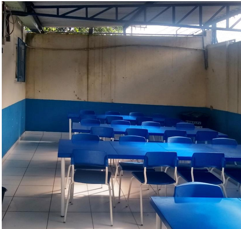
Como ilustra a imagem 3 – Refeitório da EMEF Bicanga