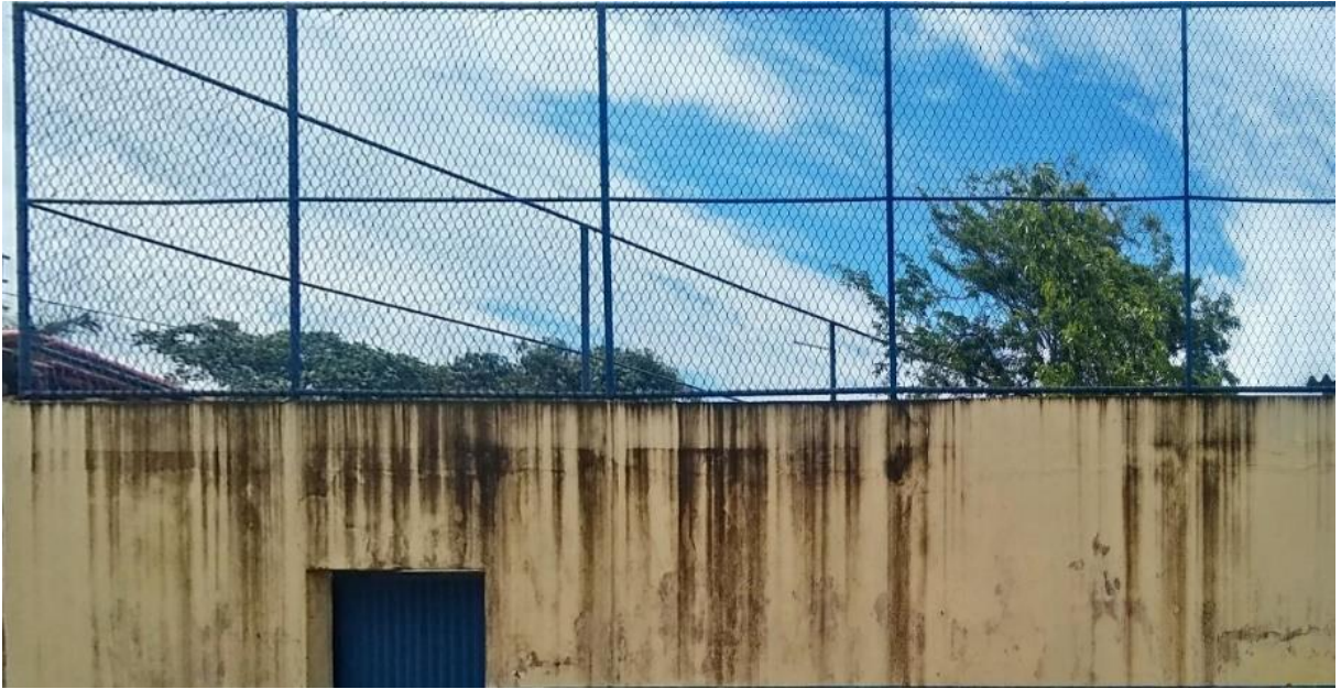
Imagem 7 – Estacionamento sem telas de proteção “descoberto”