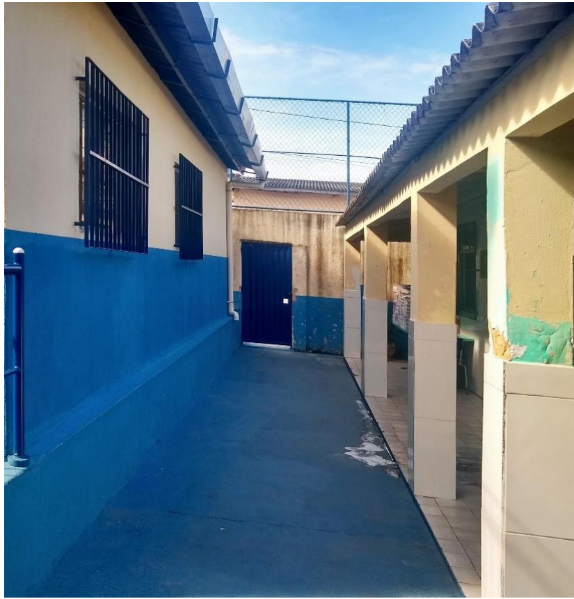
Como ilustra a imagem 2 – Entrada da EMEF Bicanga