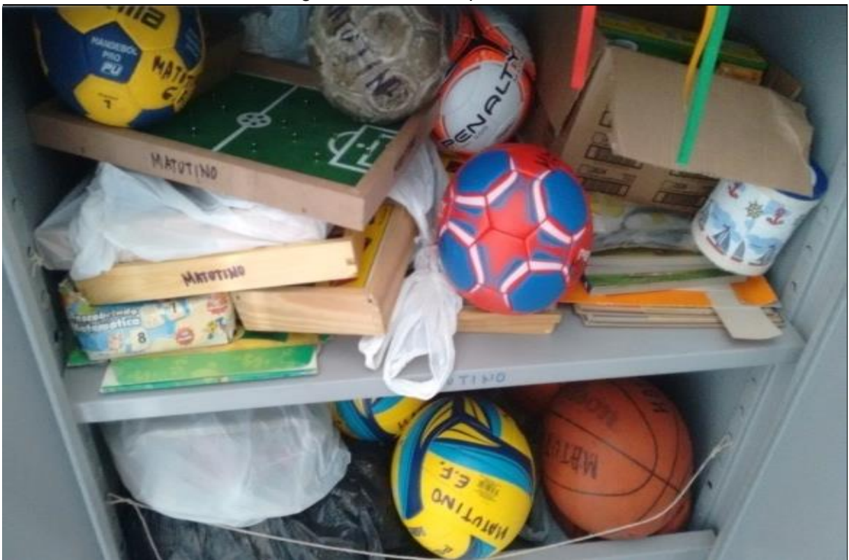
Imagem 6 – Materiais para trabalho

A seguir, fotografias dos materiais para trabalho das aulas de educação física.