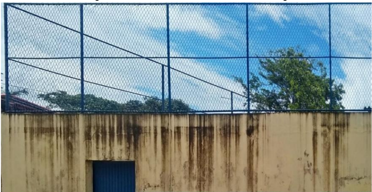
Imagem 1 – Visão da área externa da EMEF Bicanga

A seguir, fotografias da estrutura física e interior do EMEF Bicanga, retiradas durante o período de coleta de dados para a pesquisa.