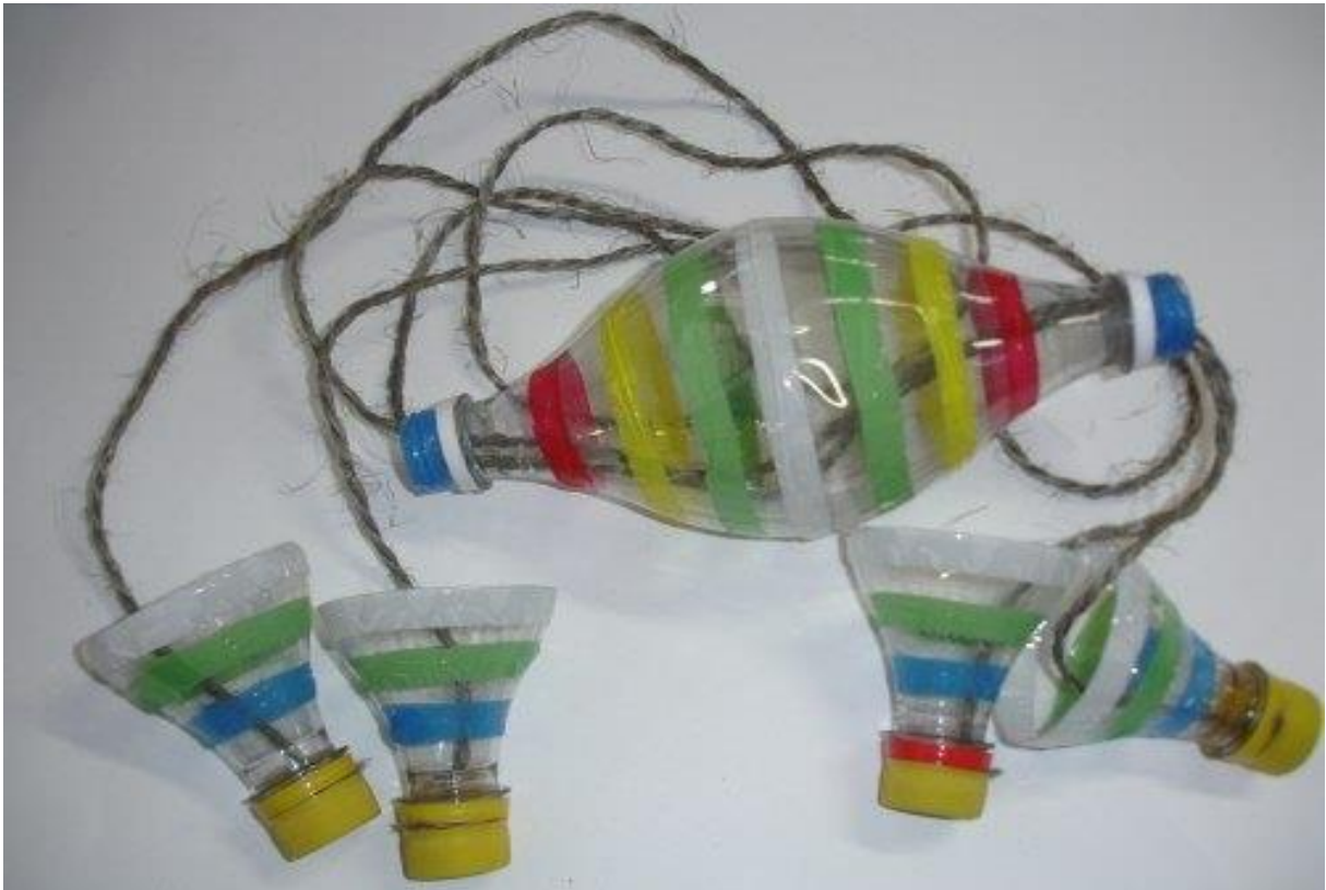
Imagem 8 – Material reciclável