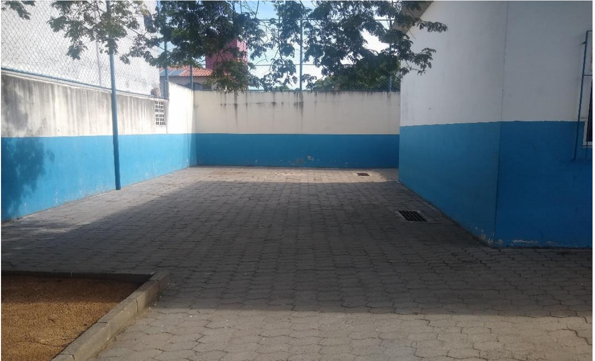
Como ilustra a imagem 5 – Espaço destinado as aulas de Educação Física II