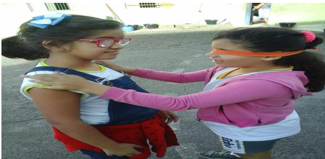
Fotografia - 4