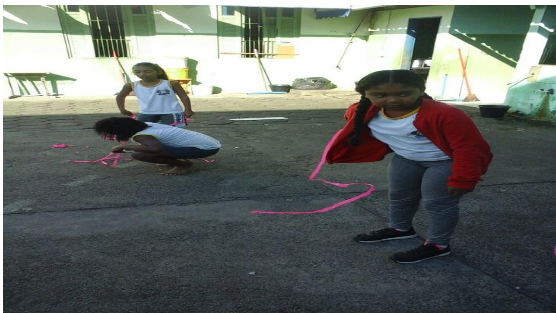
Fotografia - 7

No plano 5 a professora avaliou o trabalho em equipe o desenvolvimento do lúdico com instrumentos de dança, e o processo de criação coreográfica em grupo. E houve a roda de conversa, para avaliação da aula onde eles mostraram o que poderia ser modificado ou não na atividade, o que mais gostaram e o que menos gostaram.