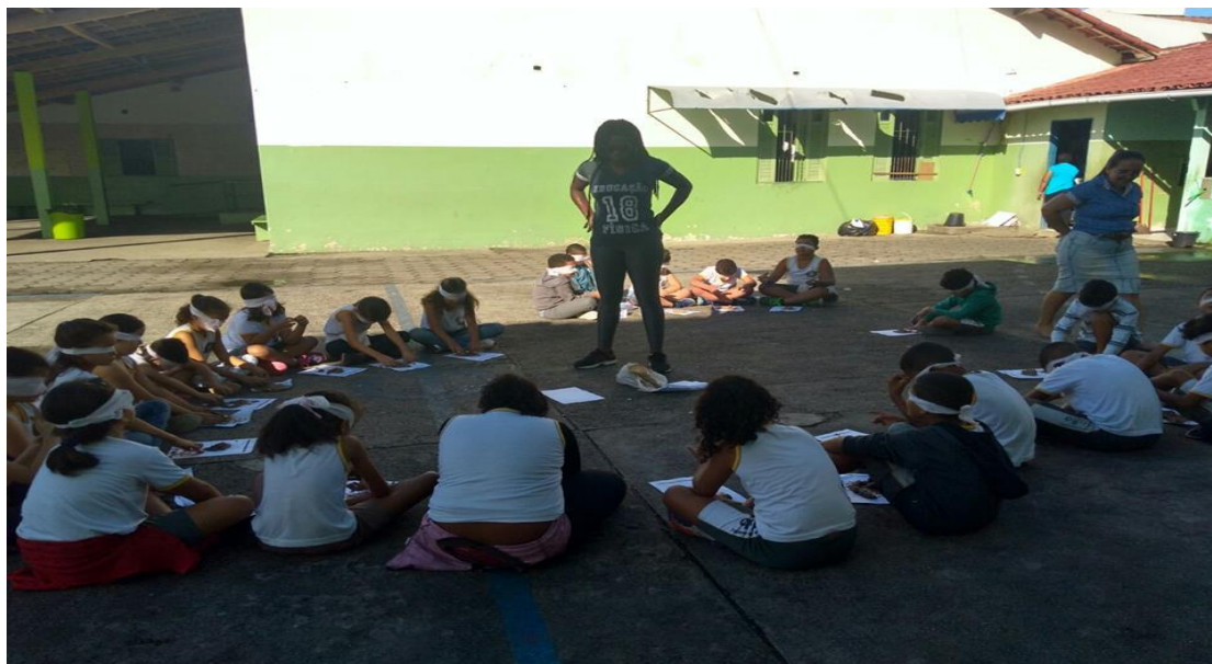
Fotografia – 2

Houve aulas que todos os alunos participaram, como a aula 1, mas na aula 3 onde houve um período de construção coreográfica, alguns alunos negaram-se participar da aula, principalmente os meninos, que por um certo preconceito com a dança e por timidez não desenvolveram a atividade como se esperava.